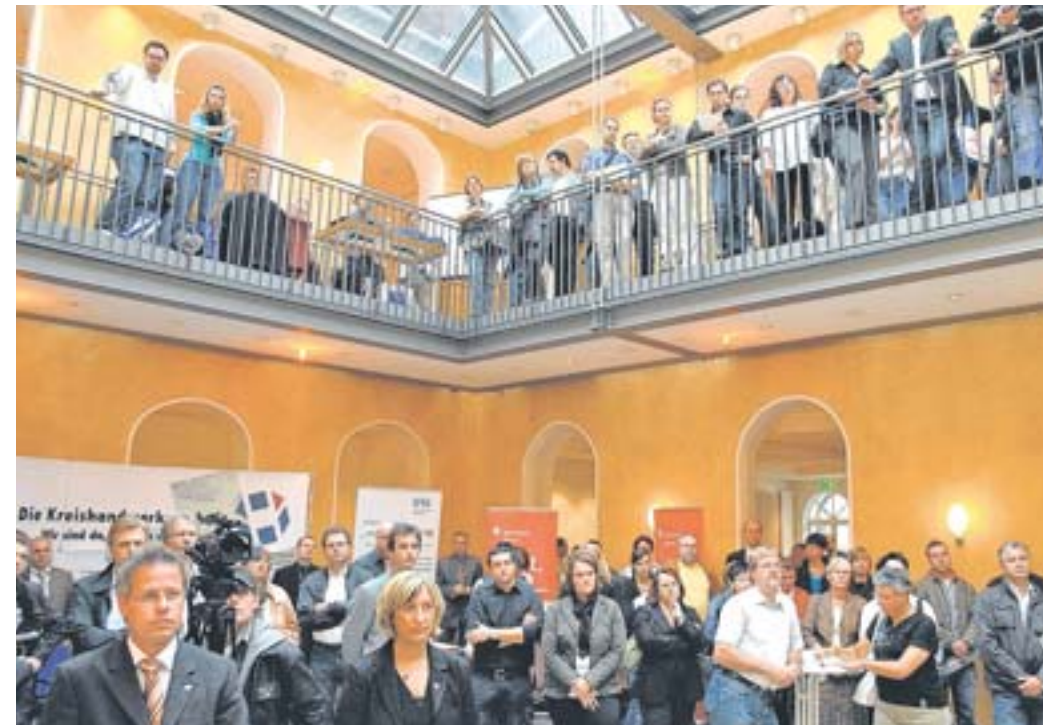
Volles Haus im Zeughaus beim Gründertag 2008: Die Mischung aus Information und Unterhaltung rund um das eigene Unternehmen war ein Publikumsmagnet.

www.mittlerer-niederrhein.ihk.de www.startercenter.nrw.de